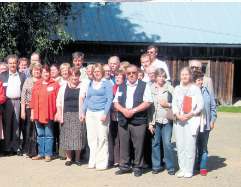
Näin paljon meitä oli koolla.