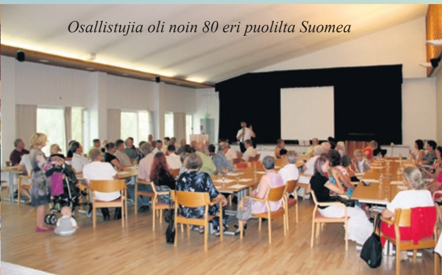
Osallistujia oli noin 80 eri puolilta Suomea