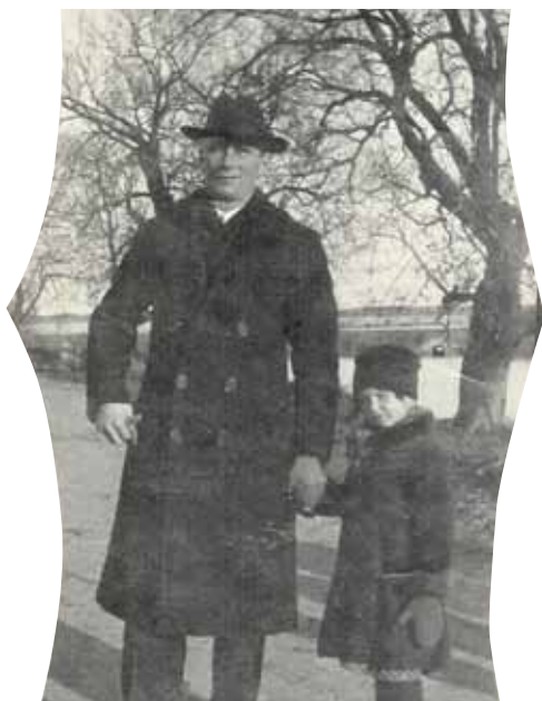
Isän kanssa Helsingissä Kaisaniemen puistossa.

Seurattiin maailman tapahtumia! Siihen aikaan oli kieltolaki. Trokareita oli myös. Tiedettiin missä niitä oli ja varjostettiin asiakkaita ja perheitä. Rouvat olivat niin hienoja. Kerran satuttiin apajalle.