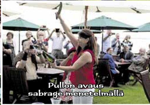
Pullon avaus sabrage menetelmällä