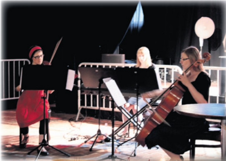
Juhla alkoi tyttötrio Maranyan musiikkiesityksellä.

Juhla päättyi yhteisesti laulettuun Karjalaisten lauluun, jonka jälkeen oli vuorossa lounas.