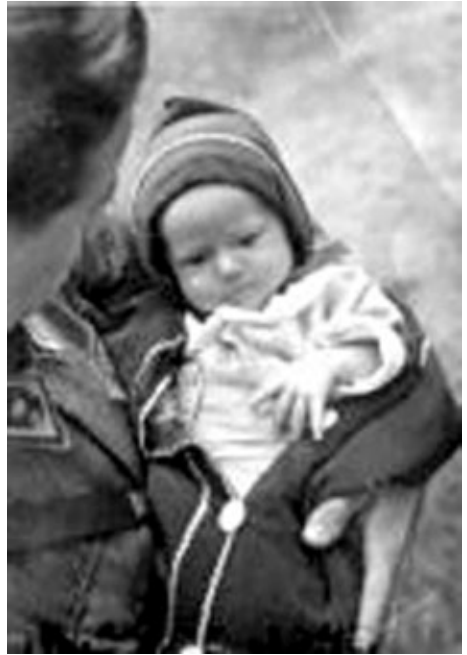
Isä ja poika

Nähdäkseni vanhempieni kohtaaminen olisi rauhan oloissa ollut erittäin epätodennäköistä. Tarvittiin maailmansota ja lisäksi pari haavoittumista, jotta heidän tiensä risteäisivät ja minä kirjoitaisin näitä rivejä. Tuo saattaa kuulostaa suurel-